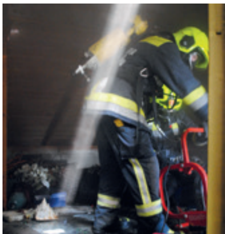
Ein Atemschutzmitglied bei einem Brandeinsatz

Ganz herzlich bedankt sich die Feuerwehr bei der Gemeinde für die gute Zusammenarbeit und bei der Ortsbevölkerung. Denn die Unterstützung der Marzerinnen und