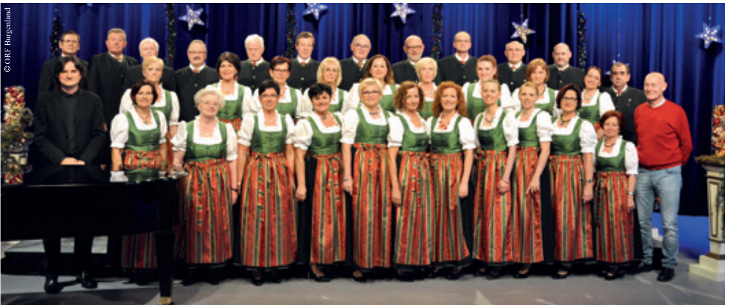
Der Gesangsverein „Liedertafel“ Marz bei der „Licht ins Dunkel“ Studioaufnahme im ORF-Landesstudio Burgenland

Ein herzliches Dankeschön allen, die zum Gelingen des Konzertes beigetragen haben.