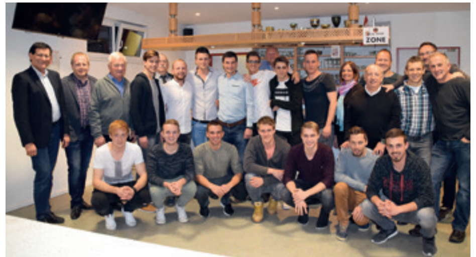
Spieler, Vorstand und Gemeindevertreter bei der Weihnachtsfeier im Klublokal