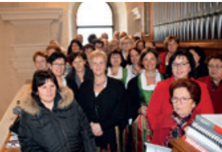
Kirchenchor und Gesangsverein beim Jubiläums-Gottesdienst zu Christkönig

Anlässlich 1000 Jahre Pfarre Marz wirkte der Chor sowohl beim Erntedankgottesdienst als auch beim großen Erntedankumzug mit. Mit viel Liebe wurde der „Sänger-