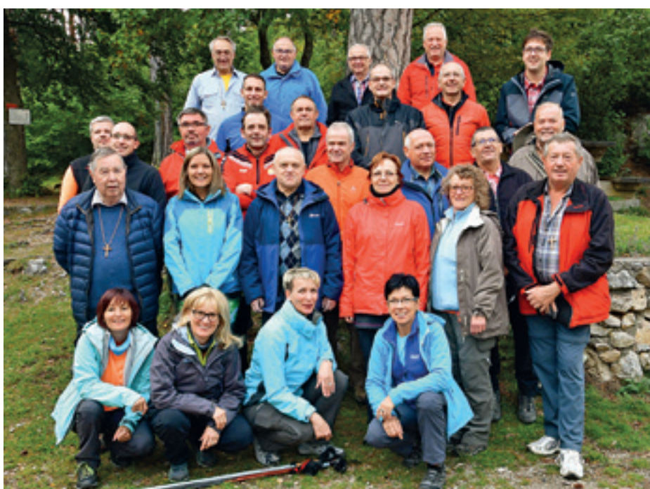
Die Wallfahrergruppe nach der Morgenandacht auf der „Flatz“